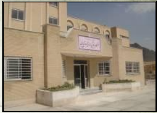
انتقال و راه اندازی خوابگاه