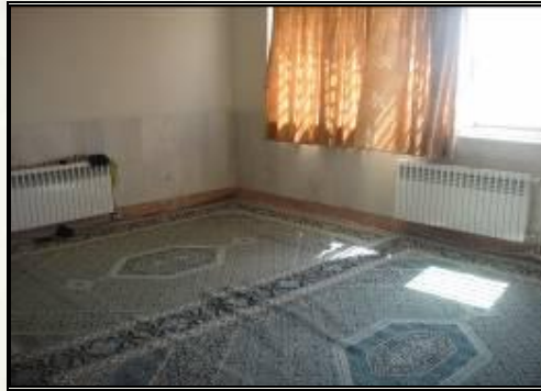
راه اندازی نمازخانه خوابگاه