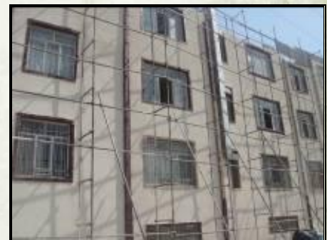
نما سازی ساختمان خوابگاه