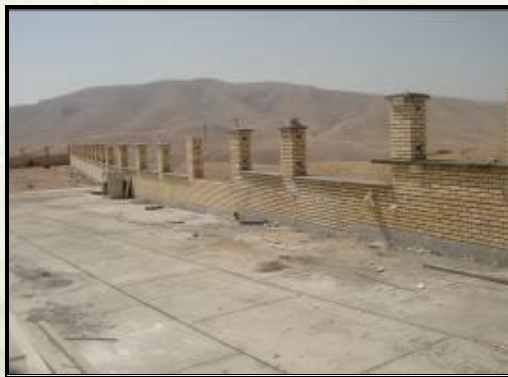
تون ریزی و حصار محوطه خوابگاه