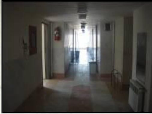
خریداری و نصب کامل تجهیزات خوابگاهی