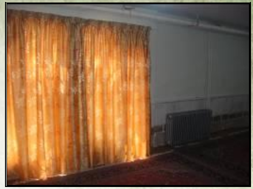
تعویض پرده‌های خوابگاه