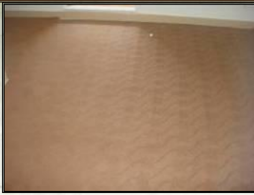
تعویض موکت‌های فرسوده