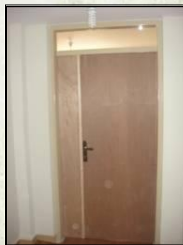
تعویض دربهای چوبی فرسوده