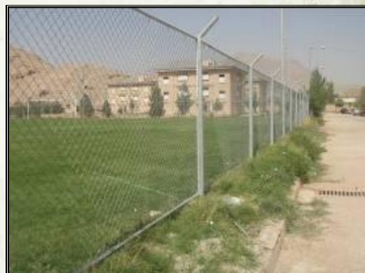
فضای فیزیکی اطراف خوابگاه نصب درب ورودی خوابگاه