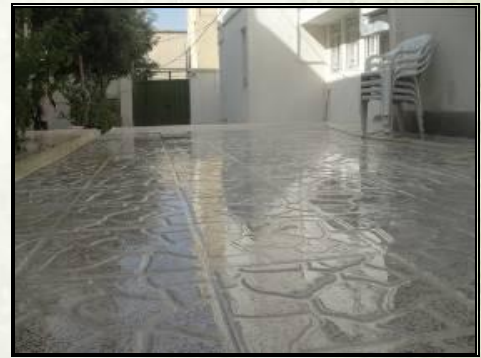
موزلیک فرش کف محوطه