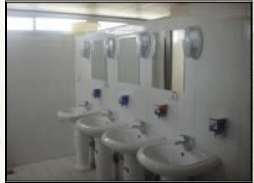
نصب شیرآلات دستویی