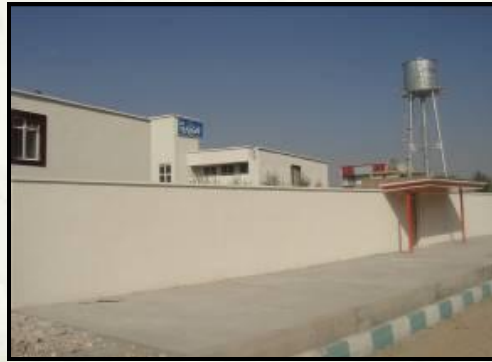
سیاحتاری پیاده رو

5- سیاحتاری پیاده رو جلو خوابگاه به متر ازش 280 متر